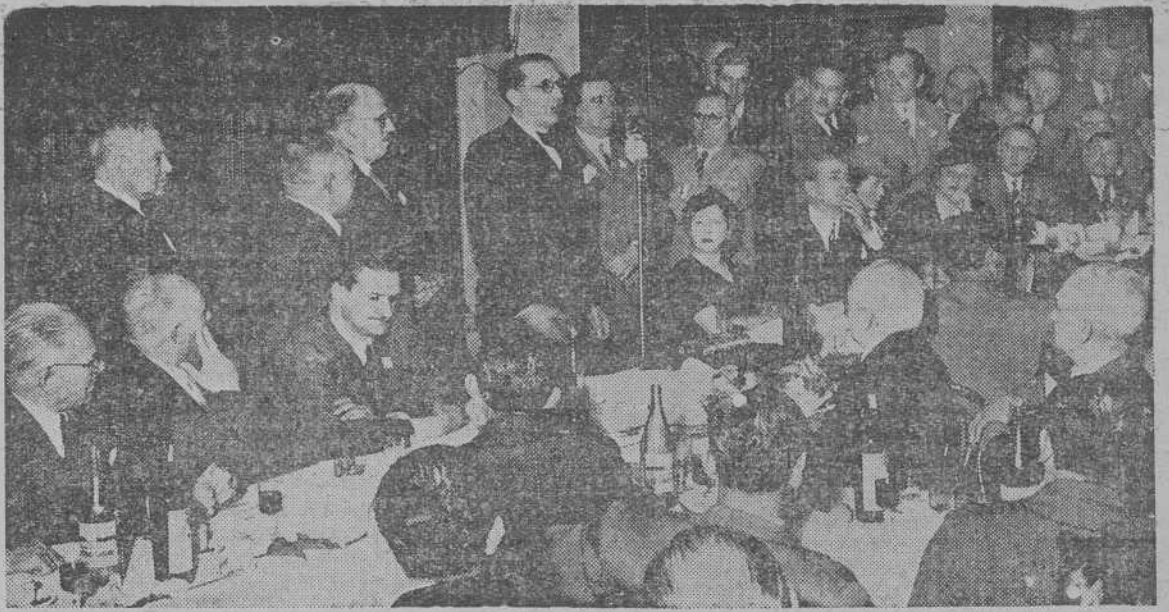
Cabeceira do banquete a Castelao. O gran "líder" galeguista fa ando