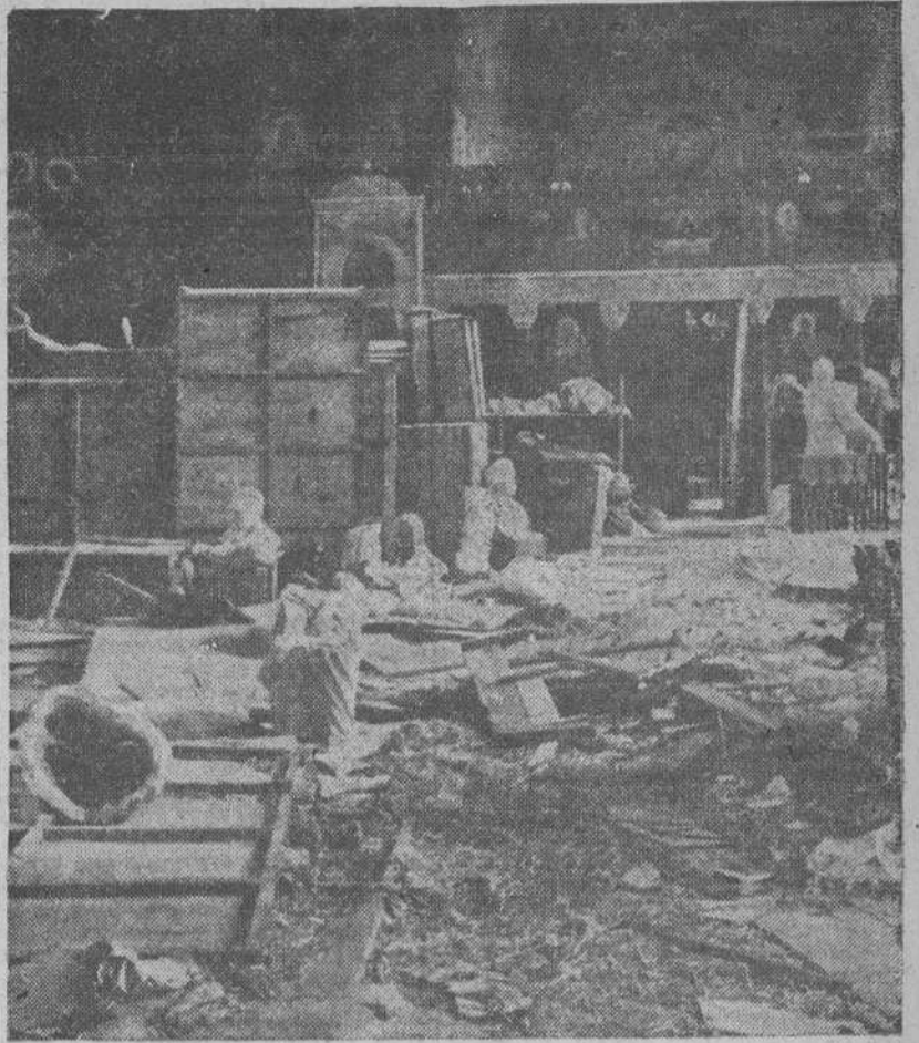
LA VIDA RELIGIOSA HA VUELTO A LA UCRANIA

Rafik Saydam descansaba desde hace días en Estambul. Nada hacía prever una muerte tan repentina. Aun ayer, el jefe del Gobierno estudiaba con funcionarios de diversos departamentos ministeriales cuestiones relativas al aprovisionamiento. Por la tarde asistió a una comedia en el Casino Municipal, y regresó a su Ho el a medianoche. Pocos instantes después de retirarse a sus habitaciones fue presa de repentino malestar. Un médico llamado urgentemente le prestó asistencia facultativa. Pero todo fue inútil. Rafik Saydam falleció a los pocos momentos.—(EFE.)