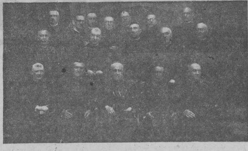
SANTIAGO.-Grupo de sacerdotes pertenecientes a la promoción de 1917, que han celebrado sus bodas de plata con el sacerdocio, reunidos con el Excmo. Sr. Arzobispo de Santiago

En la región de combate de El Alamein nuestras patrullas y columnas móviles presentaron batalla al enemigo, que fué sometido durante toda la jornada a un bombardeo intenso de nuestra aviación. En el sector septentrional, nuestras patrullas han destruido cierto número de carros adversarios y han capturado algunos prisioneros. Nuestros bombarderos y cazas redoblaron sus esfuerzos sobre la zona de batalla y observaron impactos directos en vehículos y emplazamientos de cañones, así como incendios en depósitos de carburantes. Los bombarderos ligeros provocaron también grandes explosiones e incendios. Tres cazas enemigos fueron derribados en el curso de la jornada. Durante la noche pasada, bombarderos de tipo medio de la RAF atacaron con éxito los objetivos de Tobruk. El enemigo continuó el 7 de julio sus ataques aéreos contra Malta. Nuestra caza derribó nueve aparatos del Eje y averió a otros. A consecuencia de las operaciones del desierto y de Malta hemos perdido 18 aparatos de caza, pero los pilotos de seis de ellos se encuentran en salvo.—(EFE.)"