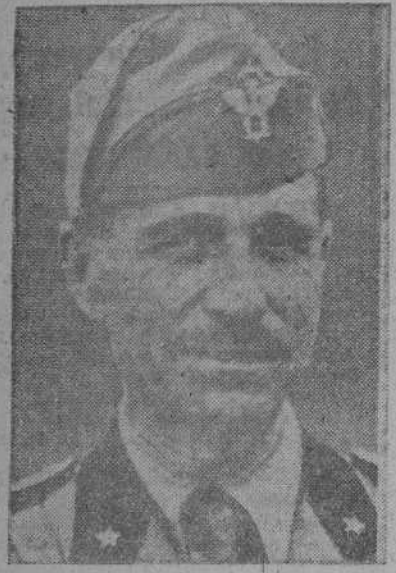
ROMA, 11.—El general Bástico, jefe de las fuerzas armadas en el África del Norte, ha sido ascendido a mariscal de Italia.

El general Ottore Bástico, Gobernador general de Libia y comandante de las fuerzas italianas en África del Norte es otro de los artífices de la gran victoria obtenida por el Eje en los campos de Egipto. Su relevante figura viene a tener actualidad en estos días de triunfo, en que ha conlucido a sus tropas con la habilidad y acierto demostrado en tantas ocasiones.