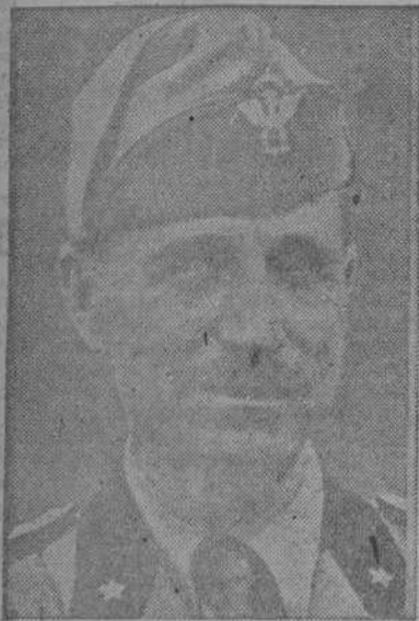
ROMA, 11.—El general Bástico, jefe de las fuerzas armadas en el África del Norte, ha sido ascendido a mariscal de Italia.—(EFE).

El general Ettore Bástico, Gobernador general de Libia y comandante de las fuerzas italianas en África del Norte es otro de los artífices de la gran victoria obtenida por el Eje en los campos de Egipto. Su relevante figura vuelve a tener actualidad en estos días de triunfo, en que ha conducido a sus tropas con la habilidad y acierto demostrado en tantas ocasiones.