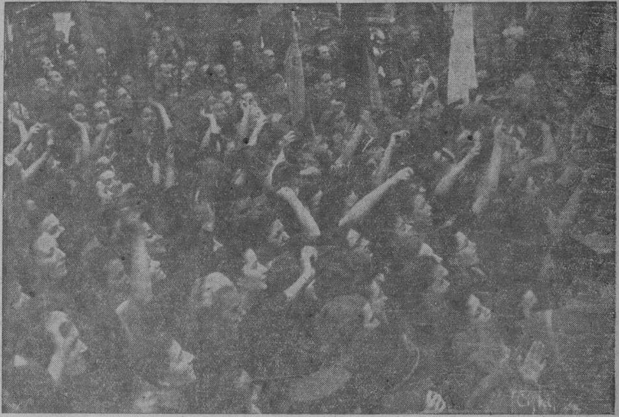
Santiago, Pontevedra, Vigo, Lugo, La Coruña y todos los pueblos de Galicia vibraron de entusiasmo frenético ante la presencia y el verbo del Caudillo. La región entera ha dado un alto ejemplo de adhesión y entrañable cariño hacia el más preclaro de sus hijos: FRANCO. Buenas lecciones de patriotismo de las que podemos sentirnos orgullosos. En prodigioso alarde de solidaridad, multitudes inmensas vitorearon a España y aclamaron al Caudillo. La "foto" recoge uno de los momentos de exaltación popular vivido por los gallegos