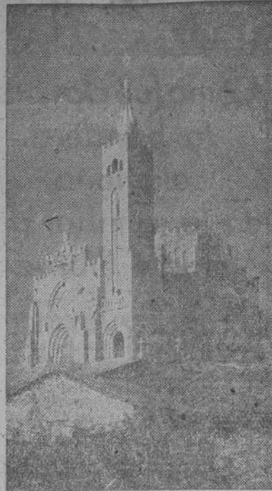
Templo votivo del mar en Panjón

Nuevas oportunidades de salud se multiplican en razón directa de la propiudad. No olvidemos que el tiempo apremia". Así lo advierte hoy el diario de Laval "Le Monteur" al hablar del momento político.