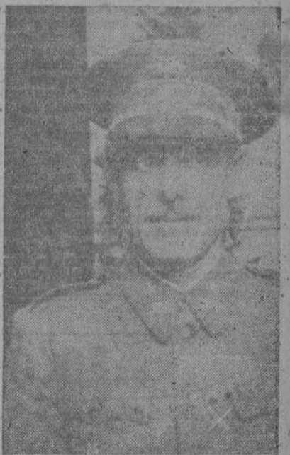
El nuevo Ministro del Ejército, general Asensio Cavanillas. Durante toda nuestra guerra de liberación se distinguió extraordinariamente por su valor, competencia y dotes de mando. Ha sido Alto Comisario de España en Marruecos, es consejero nacional de FET y de las JONS, y actualmente desempeñaba la Jefatura del Estado Mayor Central.