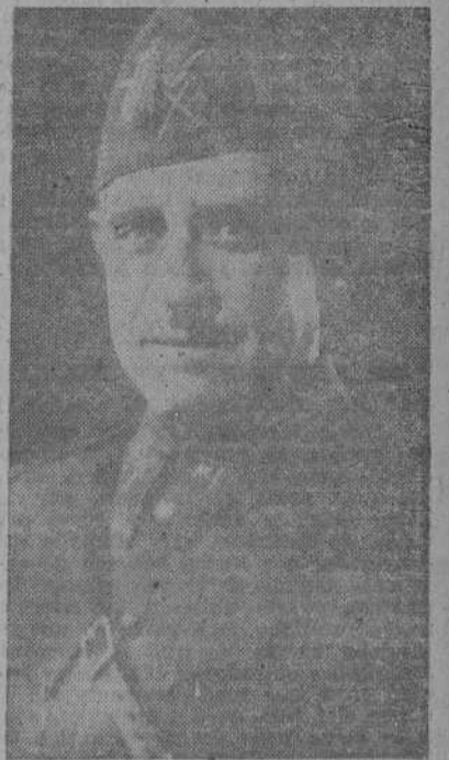
Excmo. Sr. D. Francisco Gómez Jordana, conde de Jordana, nuevo ministro de Asuntos Exteriores