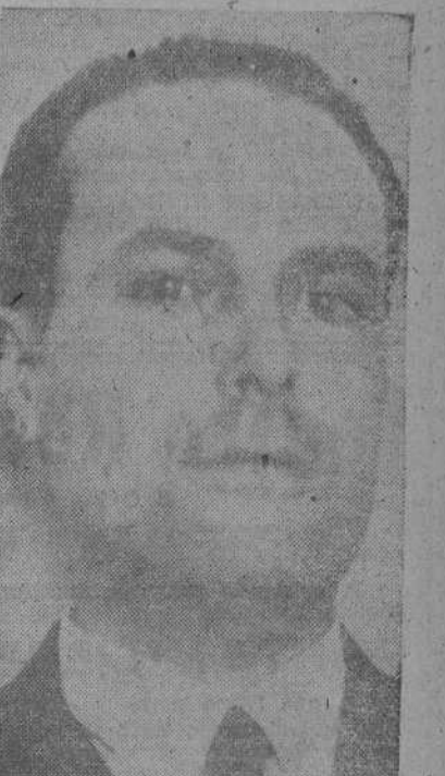
Excmo. Sr. D. Blas Pérez González, nuevo Ministro de la Gobernación