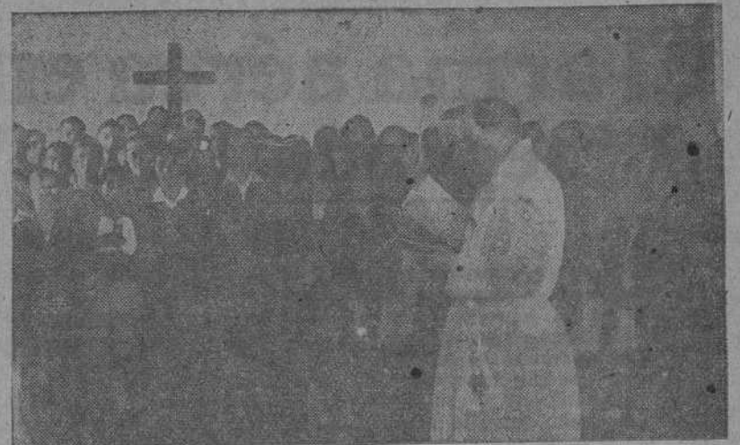
Ayer fué inaugurado y bendecido el nuevo local de Acción Católica en la parroquia coruñesa de San Pedro de Mezonzo