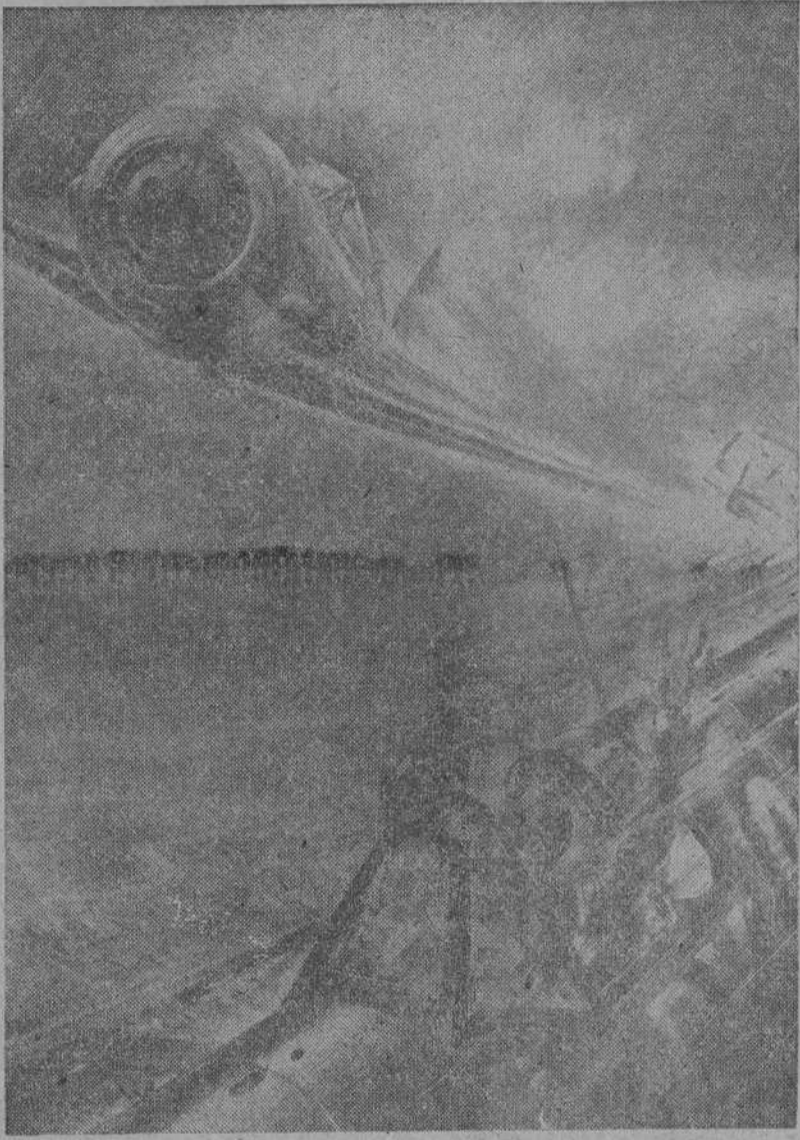
Un joven teniente alemán refirió este episodio: Durante un combate aéreo con un aviador inglés, logró aquel después de varios vuuelos de aproximación causar varias averías al avión inglés. En un nuevo vuelo de aproximación pudo ver el alemán, como el "Tommy" tiraba la cubierta de su cabina y levantaba ambas manos, la señal de su capitulación. Se dejó caer del aparato y pocos momentos después llegaba a tierra con su paracaídas.

En la mañana del 19 de agosto, al iniciarse el desembarco en Dieppe, simultáneamente a las fuerzas que atacaban, presentose la aviación inglesa con fuerzas extraordinariamente potentes y concentradas con anticipación. No hay duda que este crecido número de aparatos británicos no ha podido estar concentrado siempre en el sur de Inglaterra. Esta concentración, según los datos de la batalla, hacen suponer, debió ser efectuada de acuerdo con un plan pensado y estudiado hace mucho tiempo. No es, pues, un intento, sino una operación planeada en gran escala ésta con que se pretendía crear el segundo frente en la zona ocupada francesa. Por otra parte, hay que relacionar con dicha operación, los numerosos raids llevados a cabo por la aviación británica en las noches anteriores al 19 de agosto sobre territorio del oeste ocupado. En el ataque a Dieppe disponían los británicos de más de 100 bombarderos, muchos de ellos cuatrimotores y por lo menos de un millar de aviones de caza dedicado en especial al ataque de las defensas costeras. Los cazas se reclutarían entre los del tipo Gloster "gladiator"; y entre los bombarderos abundarían los "Hurricanes", los "Typhoons" recientemente puestos en servicio y algún "Spiffire"