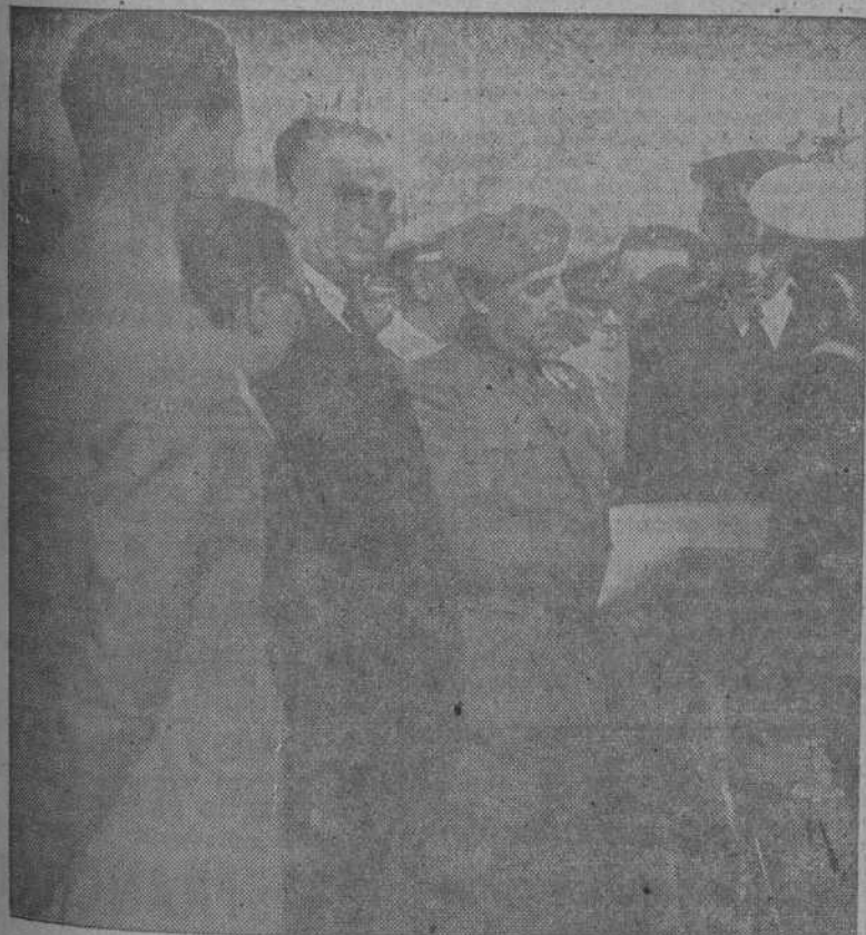
El Caudillo durante su visita al puerto de Gijón