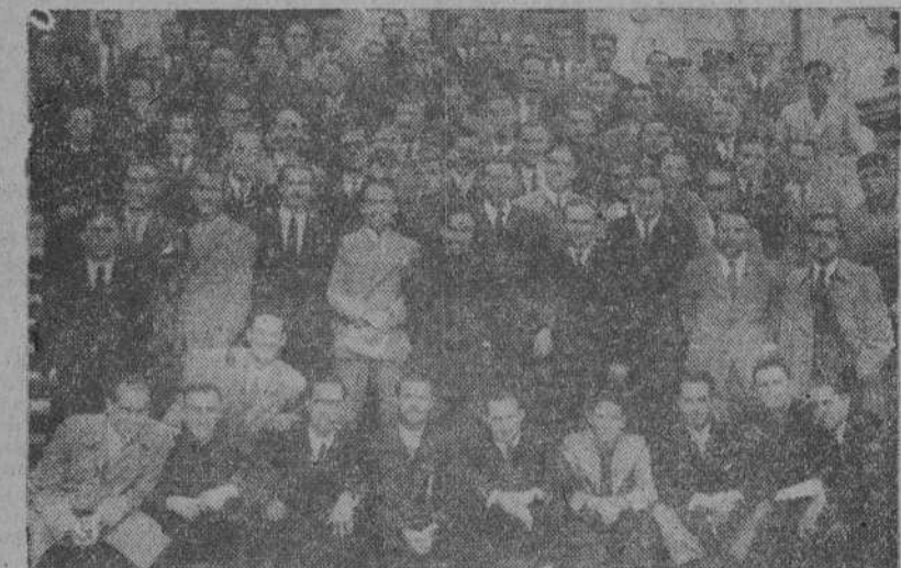
Los maestros que están efectuando un curso de instructores del Frente de Juventudes, de La Coruña

También acompañarán relación duplicada de los peticionarios por orden de mayor a menor puntuación.