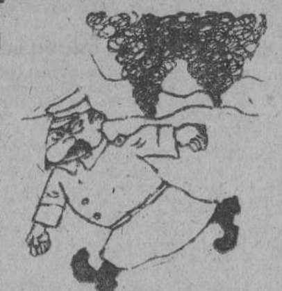
PETROLEO ARDIENDO, por Galiado. —No me sirven de nada tantos humos.

"En la noche del miércoles al jueves bombarderos pesados atacaron los objetivos de Alemania occidental y septentrional entre ellos los astilleros de construcción de submarinos de Flensburg. Aparatos del servicio costero atacaron un convoy enemigo a lo largo de la costa holandesa. Tres barcos de tonelaje medio resultaron alcanzados. Diez de nuestros bombarderos no han regresado de estas operaciones".—(EFE).