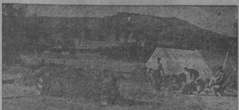
Aspecto que ofrece la preparación y montaje del campamento, con el gran Monasterio al fondo, tumba del Fundador