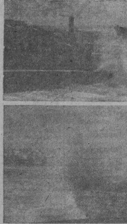
Todos los años nos ofrece el Orzán el espectáculo de su furia. Olas gigantescas, al romper contra el muro, son elevadas a gran altura, y en torrencial catarata, arrastran cuanto encuentran a su paso. He ahí dos aspectos del embravecido mar corrués, captados ayer por nuestro fotógrafo.