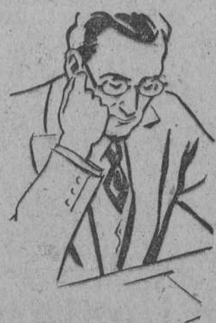
Centura Sanitaria n.º 26

BERLIN, 7.—El Dr. Goebbels, ministro de Propaganda alemán, publica en el semanario "Das Reich" un artículo dedicado a ciertos métodos de formación británicos, que—dice—consisten en propagar continuamente noticias intencionalmente falsas sobre personalidades alemanas y de la situación en Alemania. El Dr. Goebbels explica la razón de que el Gobierno alemán no desmienta las afirmaciones de aquella índole: "El ministro de Propaganda escribe su titular, se transformaría en ese caso en una "máquina de mentis" en vez de defender a la faz del país y ante el mundo entero el punto de vista alemán, que es lo que querían los ingleses". Afirma Goebbels a continuación que la propaganda inglesa no logra siquiera el enfado de Alemania cuando vierte aquellas especies, que—dice—no causan bajas en los ejércitos, que son los que ganan las guerras. "Los ingleses—arguye el artículo—se darán seguramente cuenta de que el hecho de que discutamos este asunto es para ellos alarmantemente sintomático; si no lo hicieran tendrían un pretexto para seguir en aquella actitud. Ahora bien, ¿por qué nos importan los ingleses? Únicamente porque son nuestros enemigos; pero ni discutimos con ellos ni nos preocupa su opinión. Sabemos cuáles son sus fines y sus deseos y la conclusión que sacamos es sólo ponerlos en guardia contra ellos".—(EFE)