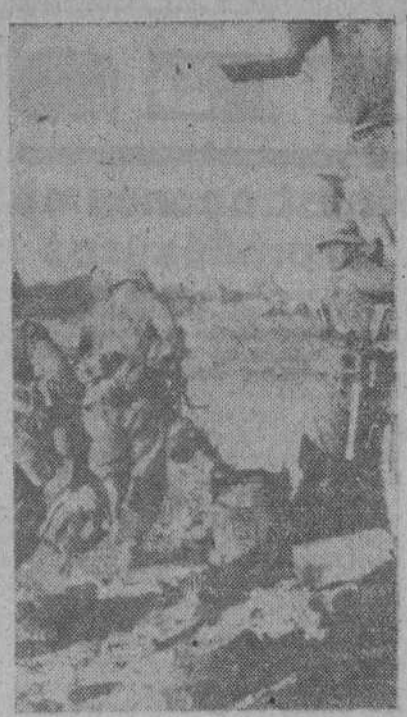
La infantería alemana, en Stalingrado, desalojando a los rusos de las casas y fábricas convertidas en fortalezas provistas incluso de artillería de grueso calibre

Ayuntamiento de Salas CONVOCATORIA DE OPOSICIONES A PLAZAS DE OFICIAL 1.º, 2.º y 3.º En el Boletín Oficial del Estado número 274 de 1.º del actual, página 3772, se anuncia la convocatoria a plazas de Oficial 1.º, 2.º y 3.º de este Ayuntamiento con los sueldos de 6.000, 5.000 y 4.000 pesetas respectivamente a los turnos de Oficiales provisionales o de complemento. Ex-captivos y libertinos y turno libre, concediéndose el plazo de un mes para la presentación de instancias y expresándose las normas con arreglo a las cuales han de efectuarse. Lo que se hace público para general conocimiento. Salas, a 3 de octubre de 1942. El Alcalde, JOSE A. CARRAL