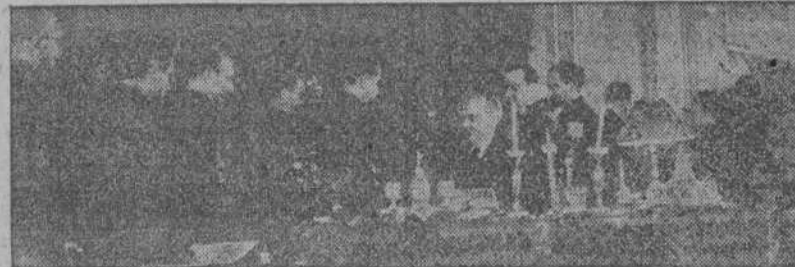
Los procuradores desfilan ante don Esteban Bilbao, presidente de las Cortes Españolas, para jurar sus cargos..