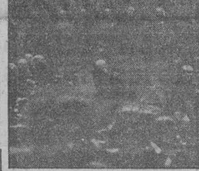
Un aspecto del salón de sesiones de las Cortes Españolas durante el solemne acto de jurar sus cargos los procuradores.