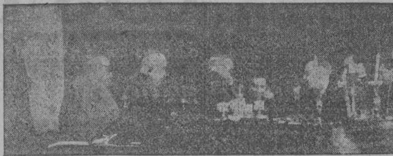
Los Arzobispos de Granada y Santiago y el Arzobispo primado Dr. Plá y Deniel, en el momento de prestar juramento ante el presidente de las Cortes Españolas..