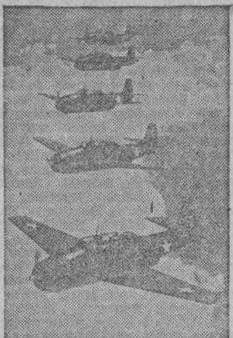
Una formación de "Avengers" de la Armada norteamericana, que colaboraron con las fuerzas navales en las batallas del Pacífico.

Hoy se efectuará el traslado de los restos de Von Moltke Le serán rendidos honores de Capitán General