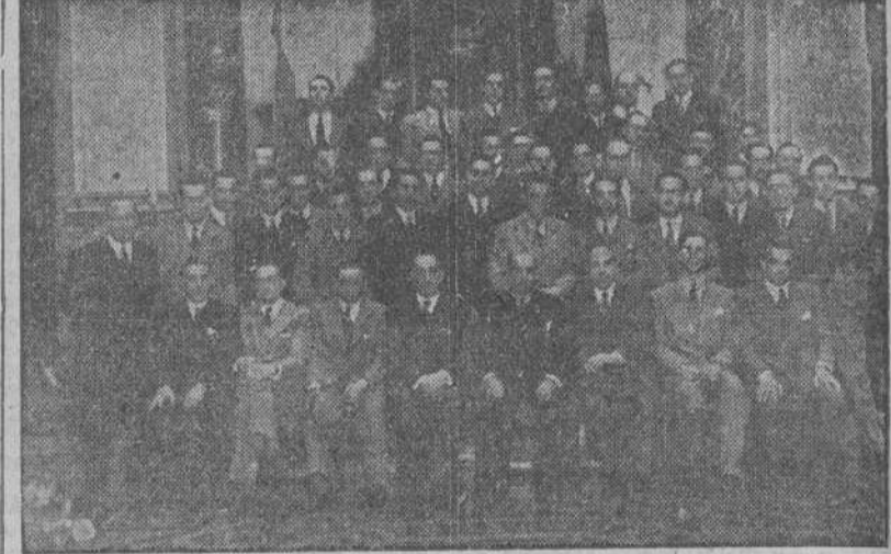
Los alumnos de la Escuela de Ingenieros de Caminos, Canales y Puertos, de Madrid, que llegaron en viaje de estudios a La Coruña, donde realizaron varias visitas, una de ellas al Ayuntamiento

Hoy irán a El Ferrol del Caudillo, de donde retornarán por la noche, y mañana saldrán de regreso a Madrid.