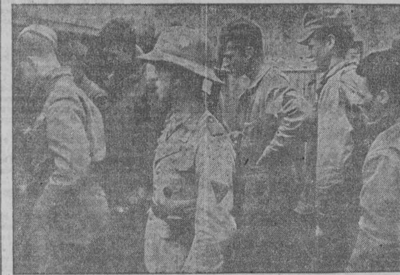
Soldados norteamericanos capturados en el frente tunecino

BERLIN, 9.—"Al Sur y Sudeste de Túnez—dice la Oficina Internacional de Información—los movimientos de repliegue del Eje no han podido ser seguidos por los aliados, de forma que