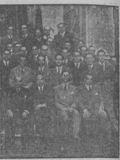
Los alumnos de la Escuela de Ingenieros de Caminos, Canales y Puertos, de Madrid, que llegaron en viaje de estudios a La Coruña, donde realizaron varias visitas, una de ellas al Ayuntamiento

Se trató de la consignación que concedió el Gobierno para el Año Santo, estudiándose su distribución. Se acordó ir a la iluminación extraordinaria de la Catedral, tanto en el interior como en el exterior, proyecto que será encargado al autor de otras iluminaciones que fueron muy elogiadas en la Exposición nacional de Barcelona. Se trató también de la cuestión del alojamiento de peregrinos, pensándose habilitar algunos edificios para hospederías. Serán reparados los accesos a la Basílica. Se acordó instalar la Exposición Jacobea en el Palacio de Gelmírez. Las iluminaciones de la Catedral, así como la Exposición, serán inauguradas en parte, en las próximas fiestas del Apóstol.