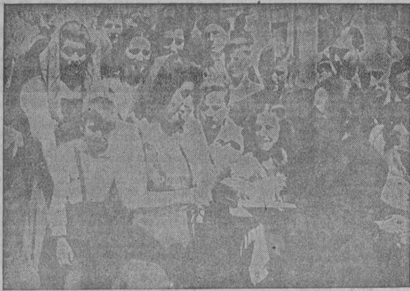
Camaradas de la Hermandad de la Ciudad y el Campo repartieron aves, conejos y semillas entre las campesinas

Camaradas de la Hermandad de la Ciudad y el Campo repartieron aves y semillas entre los campesinos