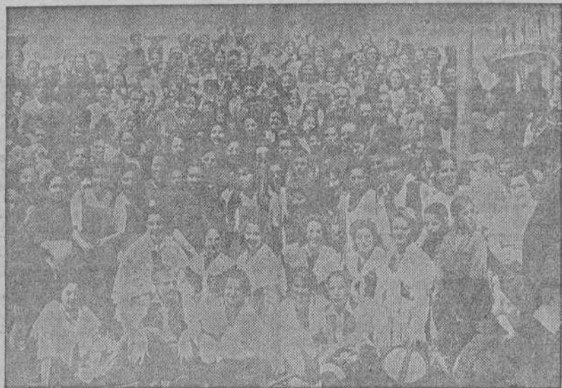
Concurrentes a la tradicional fiesta de San Isidro celebrada en la parroquia de San Pedro de Mezonzo