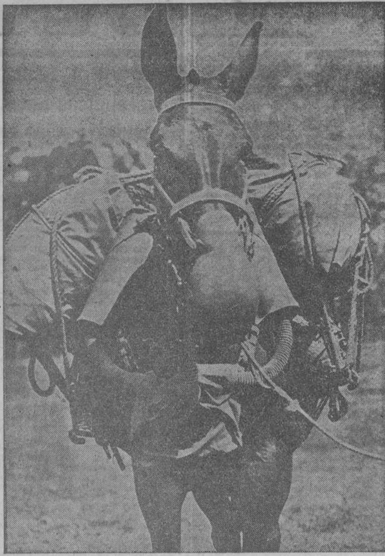
El Servicio de Guerra Química de Estados Unidos ha ideado una nueva careta de gases para los caballos y mulas, que proporciona el suficiente aire puro para que los animales puedan marchar al trote o al galope