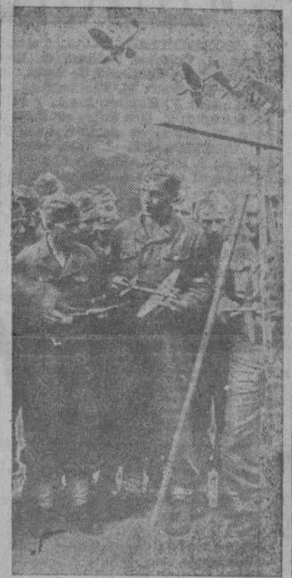
Estos muchachos de la Juventud Hitleriana contemplan las maquetas de los aparatos que más tarde aprenderán a pilotar