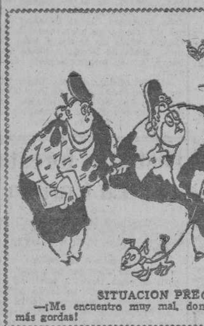
SITUACION PRECARIA, por Miranda