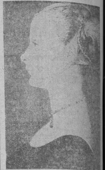
"La bella desconocida". de Piero della Francesca, según grabado de Pedro Pascual

La vida fastuosa entre tapices, joyas, estatuillas y cuadros; las reuniones de jóvenes caballeros enfundados en esbeltos jubones y estrechas calzas de gayos colores y damas ceñidas por corpiños como estuches apretados de corsé; la sociedad que ha pulimentado y alquitarado el sentido caballeresco haciendo de él una concepción lujosa, bella, delicada y galante