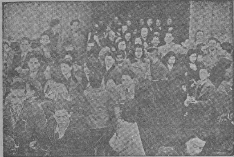
Los estudiantes coruñeses saliendo del templo de Santo Domingo, después de haber asistido a la solemne ceremonia organizada por el SEU