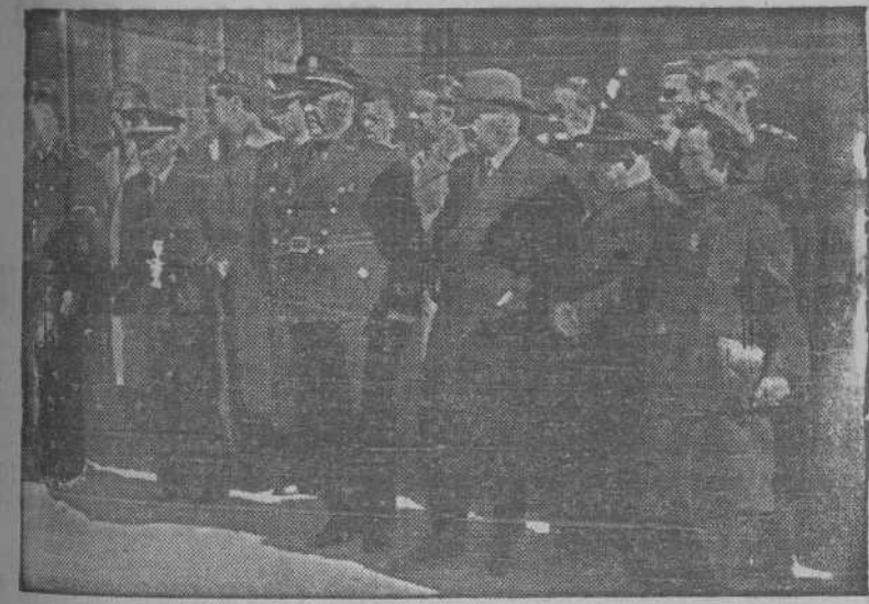
Autoridades y jerarquías presencian el desfile de las Falanges Juveniles de Franco, una vez terminada la función religiosa celebrada en el convento de Santo Domingo

La Prensa árabe de El Cairo critica duramente las declaraciones del general Smuts, especialmente en el diario "Abnam".—(EFE.)