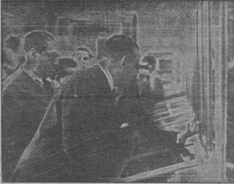
Con asistencia del Ministro de la Gobernación, el Alcalde de Madrid, y Autoridades, se ha inaugurado el Museo Prehistórico, instalado en el Museo Municipal, antiguo Hospicio de Madrid