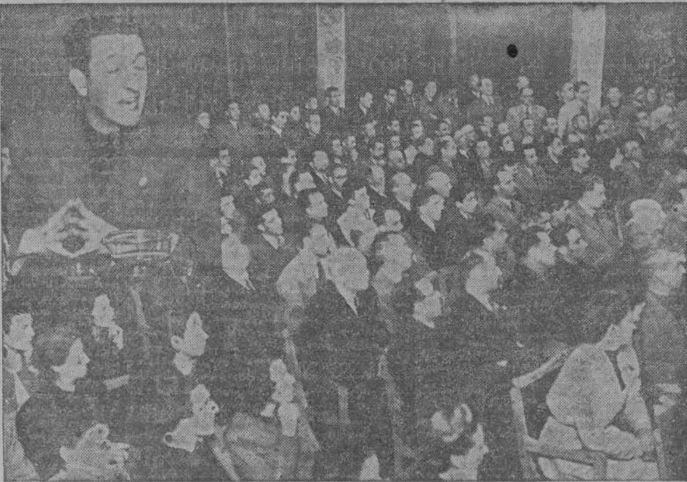
En el ángulo superior izquierdo, el jefe provincial, camarada Diego Salas, durante su conferencia sobre el tema "Revolución y evolución comunista". A la clausura del ciclo de información organizado por la Delegación Provincial de Educación Popular, asistió numerosísimo público. En el grabado, un aspecto parcial del salón de actos de la casa de la Falange.