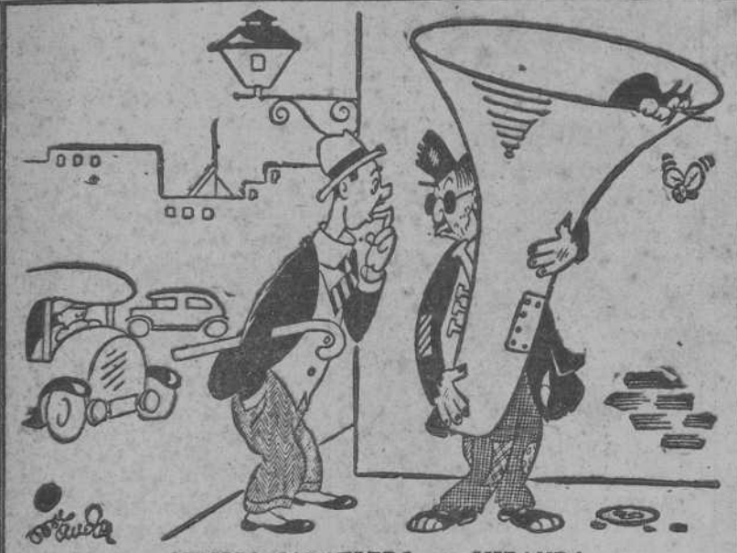
MUSICO CALLEJERO, por MIRANDA

—Si no sabe tocarlo, ¿para qué lleva ese instrumento? —Sólo como amenaza, señor.