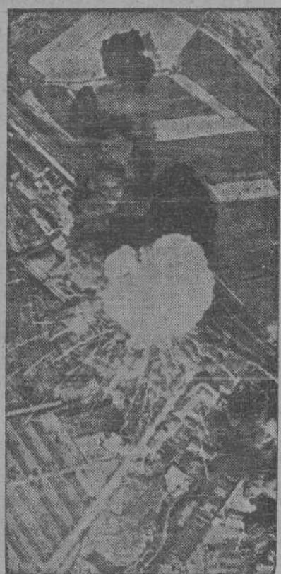
Una inmensa columna de humo blanco señala el impacto directo alcanzado por los bombarderos norteamericanos sobre un tren de municiones en los muelles ferroviarios de Orvieto

Von Ribbentrop se entrevistó con los jefes del Estado y del Gobierno finlandés