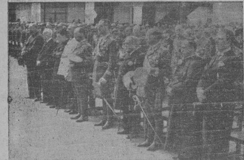
Las autoridades y jerarquías que asistieron a la ceremonia religiosa celebrada por la Agrupación de Sanidad Militar, con motivo de la fiesta de Nuestra Señora del Perpetuo Socorro

ron ayer con toda solemnidad el día consagrado a su celestial patrona la Santísima Virgen del Perpetuo Socorro. Como preparación a esta fiesta solenne han venido organizando estos días dichas fuerzas diversos actos que dejaron grato recuerdo en cuanto a ellos asistieron.