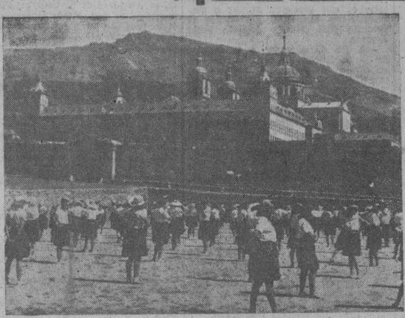
Las camaradas de la Sección Femenina que se encuentran en El Escorial, durante uno de los ejercicios de gimnasia que realizan diariamente a la sombra del Monasterio.