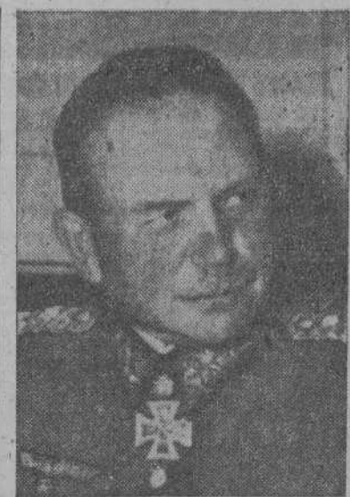
El general alemán Heinz Guderian que ha sido nombrado jefe del Estado Mayor

SENTENCIA Y EJECUCION FULMINANTE En el mismo lugar se reunió sin