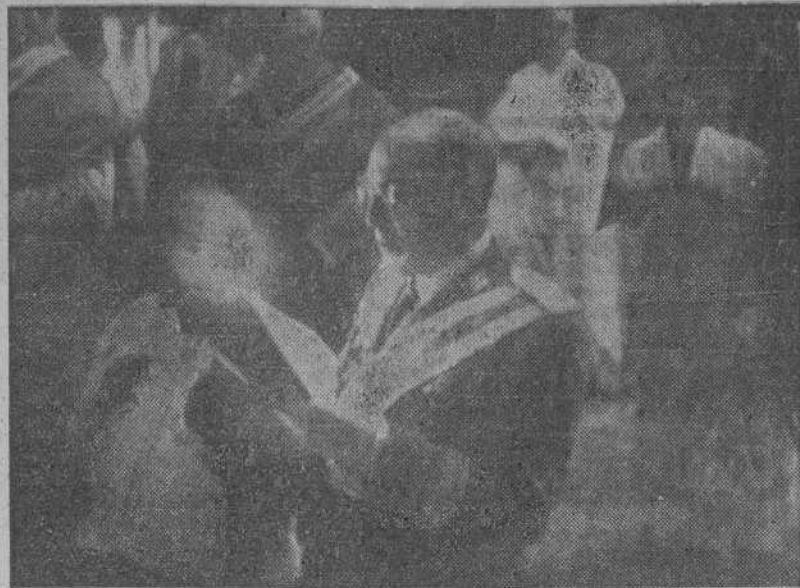
El Capitán General de la Octava Región Militar, que ostentaba la representación de S. E. el jefe del Estado, haciendo la tradicional Ofrenda al Patrón de España.