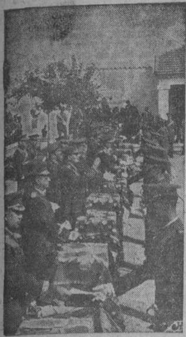
En la Academia Especial de Transformación de Oficiales provisionales y de complemento de Villaverde, el Ministro del Ejército, general Asensio, entrega solemnemente los despachos a los nuevos oficiales