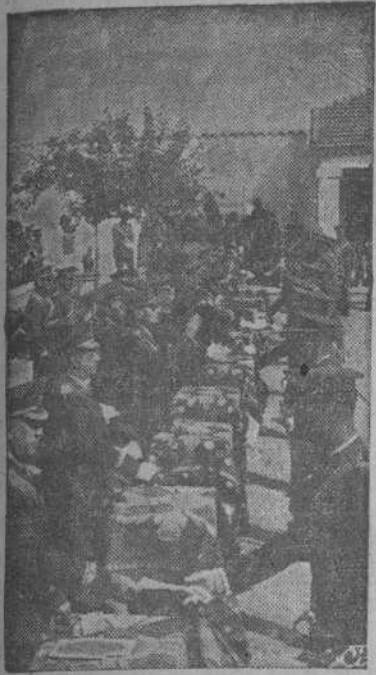
En la Academia Especial de Transformación de Oficiales provisionales y de complemento de Villaverde, el Ministro del Ejército, general Asensio, entrega solemnemente los despachos a los nuevos oficiales