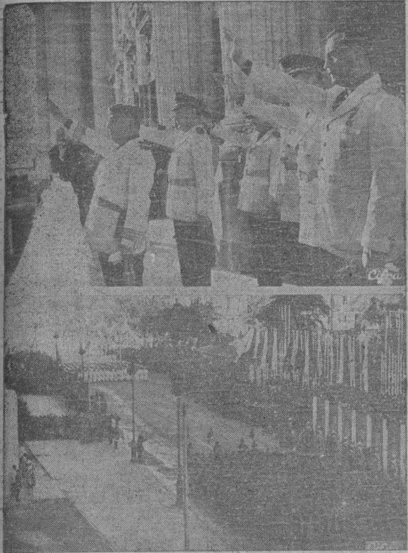
S. E. el jefe del Estado, Generalísimo Franco, presidió, en la Plaza de la Armería, la magna concentración del Frente de Juventudes celebrada con motivo del Día del Caudillo.—Abajo: Un aspecto de la magna concentración de las Falanges Juveniles de Franco celebrada ante el Jefe del Estado.