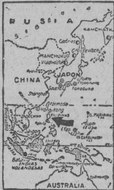
Las islas Filipinas, en la zona ya vital para el Japón

Aviones terroristas norteamericanos atacaron la ciudad de Augsburgo, Ratisbona y otras ciudades del Sur y Sudeste de Alemania, aprovechando las condiciones del tiempo, desfavorable para la defensa. En las primeras horas de la tarde, Essen sufrió un ataque terrorista inglés. Otros aviones enemigos arrojaron bombas sobre Berlín. Treinta y un aviones enemigos—22 de ellos tetramotores—han sido derribados".—(EFE).