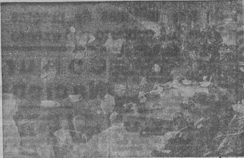
Ayudantes de un tren de aprovisionamiento, sirven una comida caliente a un grupo de soldados de la Marina de guerra alemana que se dirige hacia el frente.