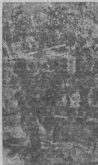
Granaderos alemanes con la nueva arma "Terror de los tanques" marchan hacia nuevas posiciones