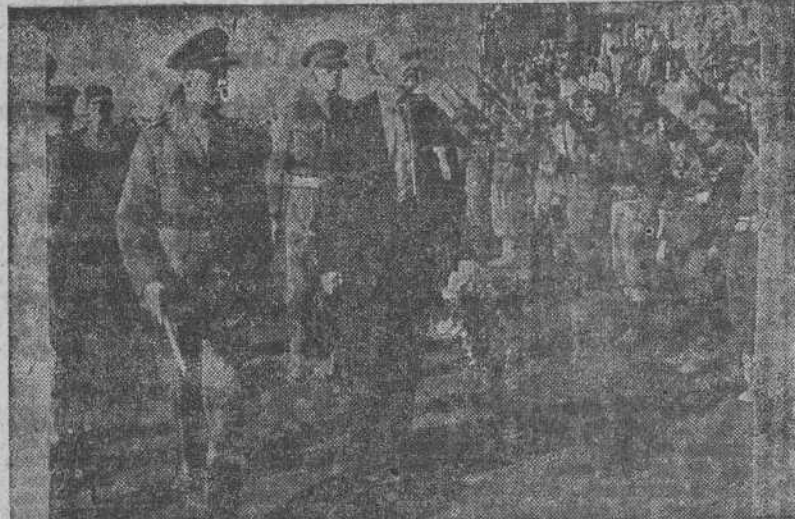
El primer ministro griego, Papandreu, pasa revista, en compañía del general inglés Scobin, a la Guardia de Honor que le recibió al hacer su entrada en Atenas..