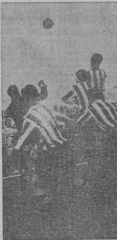
Acuña en un discurso de puño.

Las Jerarquías se reunieron después en un acto íntimo. Por la tarde, las Jerarquías nacionales del SEU y las del Frente de Jóvenes así como gran número de estudiantes se trasladaron al Cementerio del Este, donde el Jefe Nacional del Sindicato Español Universitario depositó una gran corona en nombre del Sindicato, sobre la tumba de José Miguel Guitarte.—(CIFRA).