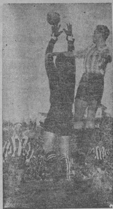
Acuña para el balón por alto, ganando la acción al delantero atlético, que intentaba el remate