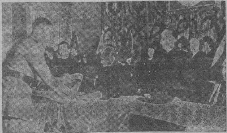
En la Universidad Central en presencia de los Ministros Secretario del Movimiento y de Educación Nacional, se ha procedido a la entrega de becas a los estudiantes.