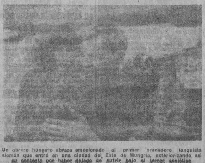
Un obrero húngaro abraza emocionado al primer granadero tanquista alemán que entró en una ciudad del Este de Hungría, exteriorizando así su contento por haber dejado de sufrir bajo el terror soviético.