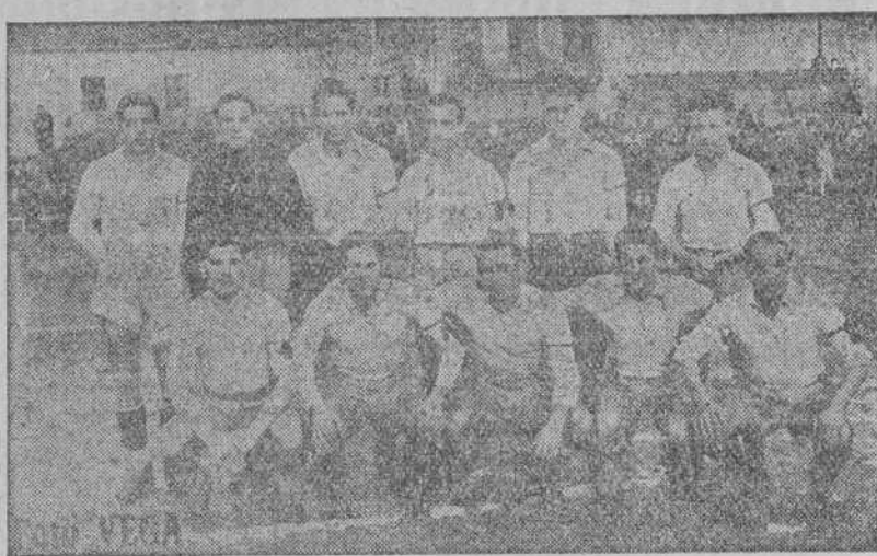
El equipo S. G. Lucense que, con el triunfo sobre la Ponferradina (4-0), en partido celebrado el domingo, 21, en el campo del Polvorín, ha quedado proclamado campeón del primer grupo de la tercera división

Concesión para fundición de hierro colado. Dirigirse por escrito a Publicidad Cafranga. San Sebastián