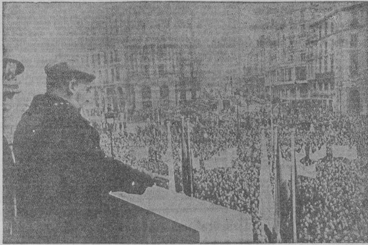
Desde el balcón de la Secretaría General del Movimiento el Caudillo recibe las aclamaciones de los ferroviarios y de la población madrileña