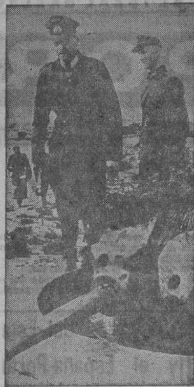
El mariscal von Rundstedt inspecciona personalmente los puestos avanzados en el campo de batalla del Oeste.

Teléfonos de EL IDEAL GALLEGU Admón. 1542; Redacción 1177 y 1594