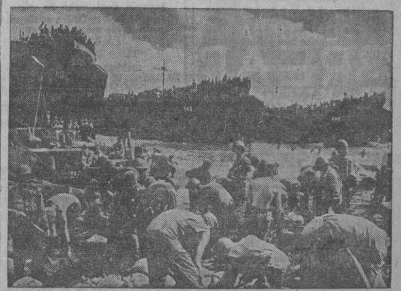
Mientras por las portezuelas de proa de las naves anfibas de ataque salen más hombres y material americano, otras tropas llenan sacos de arena para los emplazamientos artilleros en las playas filipinas