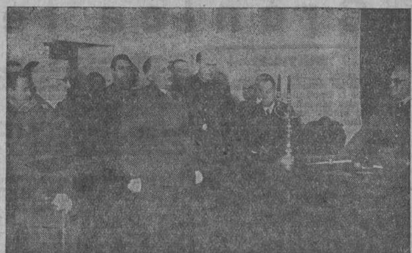
Pontevedra.—El general de Estado Mayor don Fermín Gutiérrez de Soto, hijo adoptivo de Pontevedra, pronuncia unas palabras de agradecimiento después de serle impuesto el fajin que el Ayuntamiento le regala y que ha sido adquirido por suscripción popular