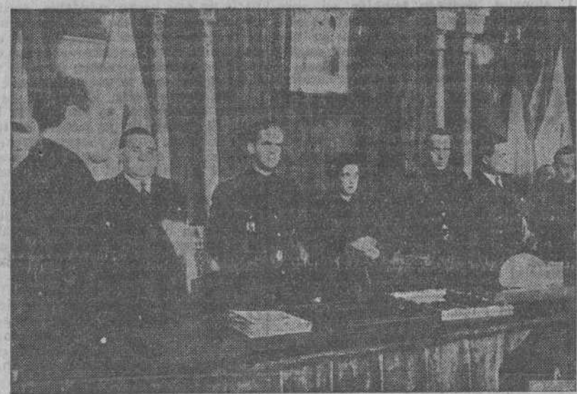
BILBAO.—Con motivo del Consejo de la Sección Femenina le ha sido tributado un homenaje al Vicesecretario del Movimiento, camarada Vivar Téllez. El Alcalde de Bilbao durante su discurso