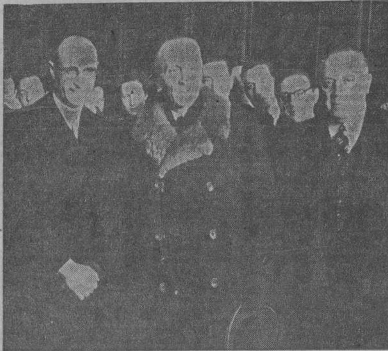
El nuevo embajador de Italia en España, Duque de Gallari, a su llegada a Madrid