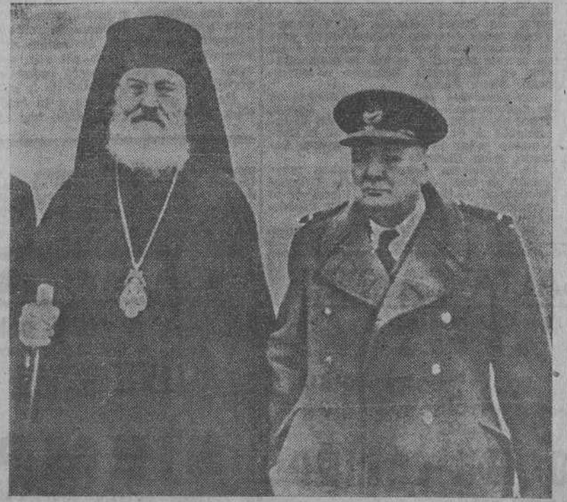
El Arzobispo Damaskinos, Regente de Grecia, con Mr. Churchill, que, al regresar de la conferencia de Crimea, ha vuelto a visitar Atenas

PARÍS, 16.—El comunicado del Cuerpo expedicionario aliado en el Oeste dice: "Las fuerzas aliadas han conquistado Warheyen al Nordeste de Cléveris, y han avanzado hacia el Rhin. Al Sur del bosque de Reichswald hemos ampliado nuestra cabeza de puente en el río Niers y conquistado Kessel y Hommerstun, a pesar de la encarnizada resistencia enemiga. Las plazas fortificadas del sector de Prum fueron atacadas por nuestros cazabombarderos. En la zona del Noroeste de Echternach nuestras unidades han avanzado dos kilómetros hacia el Norte, contra fuerte resistencia alemana, hasta alcanzar las alturas situadas a kilómetro y medio al Sudeste de Cruchten. Hemos ganado 300 metros al Norte de Echternach, donde continúa la limpieza de los reductos enemigos. Al Sudeste de Remich hemos avanzado un kilómetro y medio al Sudeste de Sinz. Numerosas fortificaciones enemigas quedaron limpias en esta operación.