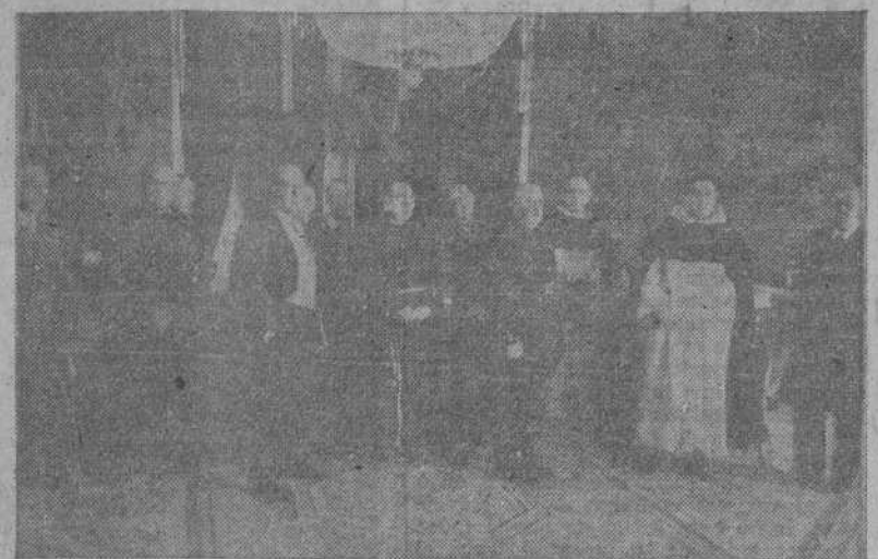
En el Palacio de El Pardo ha recibido S. E. el jefe del Estado a una comisión de Filipinas que le expresaron su agradecimiento por las decisiones tomadas en defensa de los intereses españoles en aquel lugar.