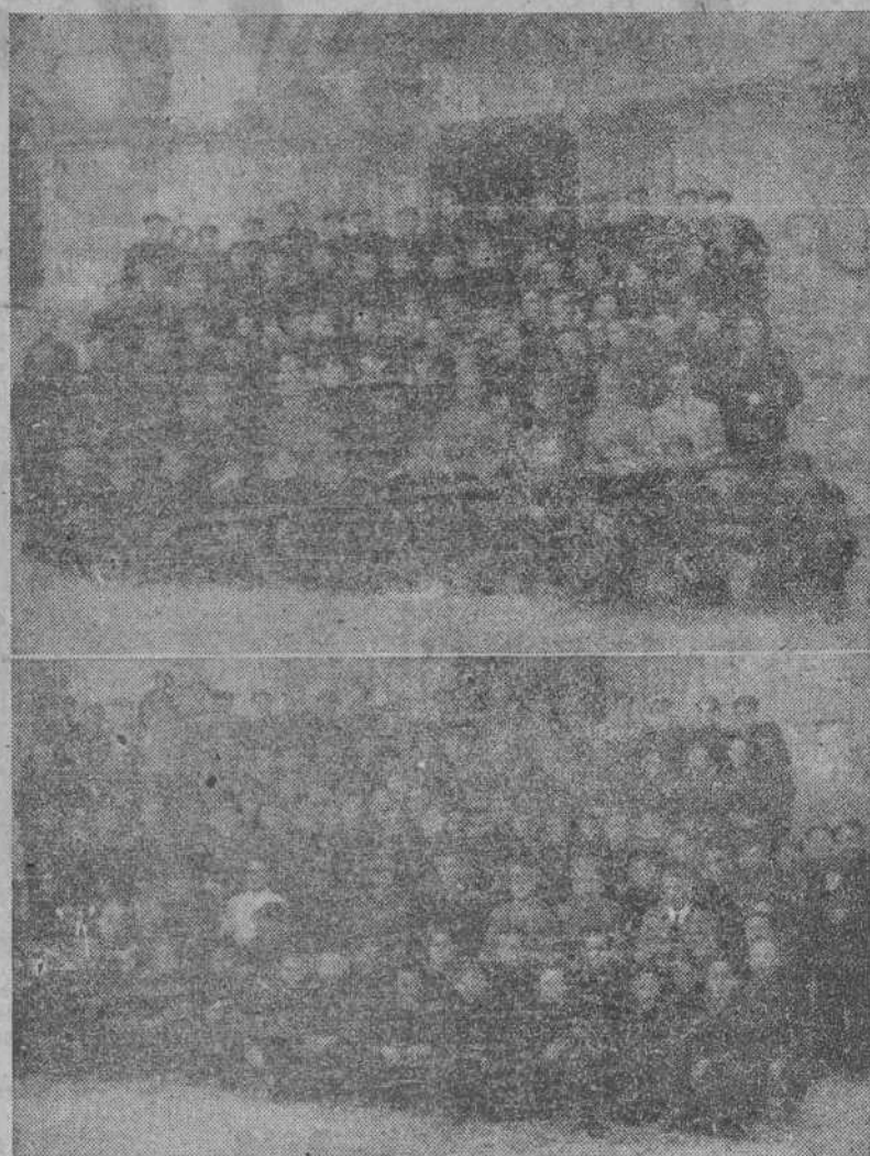
Aprendices de la Fábrica de Armas y de la Maestranza, con sus jefes y profesores, después de haber cumplido con el Precepto Pascual en la Iglesia Colegiata de Santa María