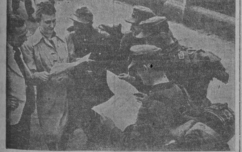
Caleños y soldados alemanes leyendo la edición del primer periódico editado en Hamburgo por el Gobierno militar aliado (Foto LOGOS).

TELEFONOS DE EL IDEAL GALLEGO ADMINISTRACION 1542 REDACCION 1177 y 1594