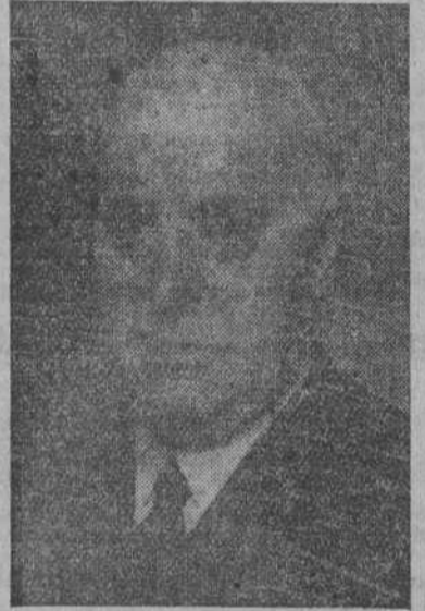
Don José Navarro Reverter, que ha sido designado nuevo Presidente de la Compañía Telefónica Nacional de España.