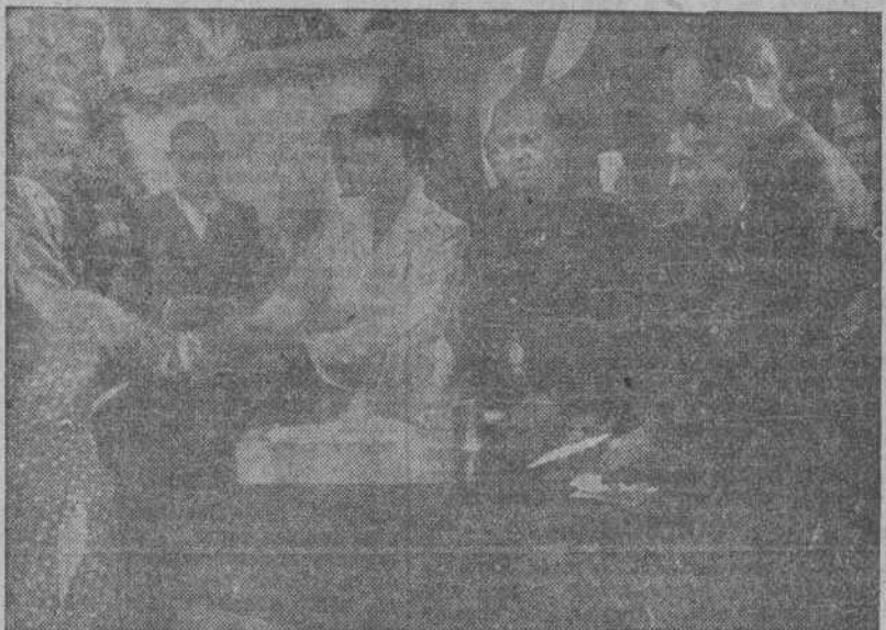
La Jefe Nacional del Servicio Sindical de Previsión Social Mercedes Sanz Bachiller, entregando subsidios a uno de los beneficiarios orensanos. La acompañan el Delegado Provincial de la Obra, el Delegado Nacional de Sindicatos, el Subsecretario de Trabajo y el Gobernador civil.