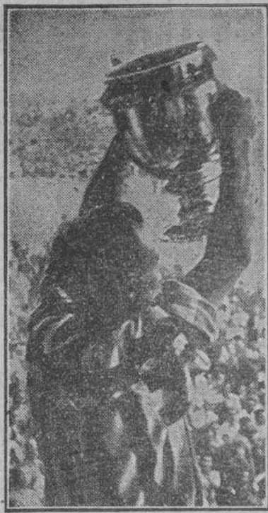
Bertol, capitán del Atlético de Bilbao, muestra al público del Estadio, la Copa conquistada en propiedad por su equipo.