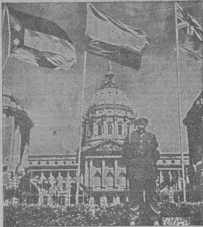
Este soldado americano monta la guardia ante los edificios donde se celebraron estos días las últimas sesiones de la Conferencia de las Naciones Unidas, cuyas banderas ondean al viento en presagio de paz

MADRID 27.—El embajador de Portugal en España doctor don Pedro Teotónio Pereira ha obsequiado a la Marina Española con un acto íntimo a que asistieron con el Ministro de Marina, los almirantes jefes del departamento y numerosos jefes y oficiales de la Armada.—(CIFRA).