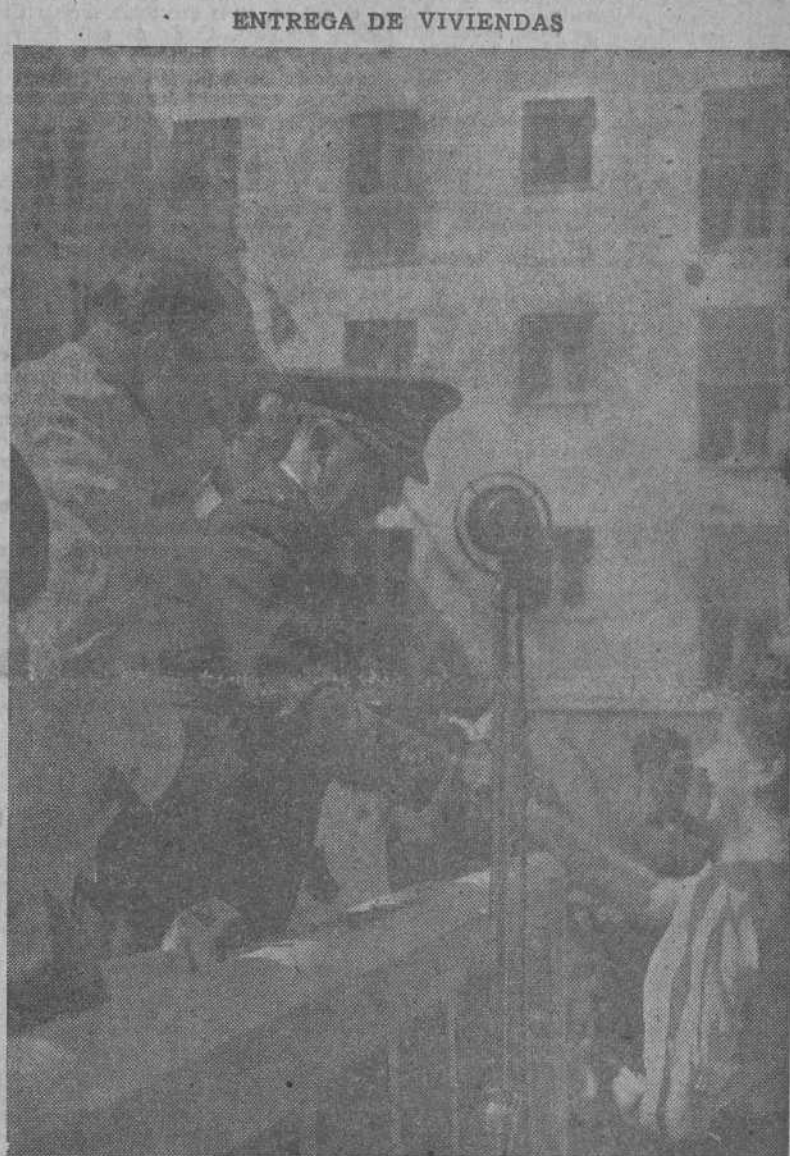
ENTREGA DE VIVIENDAS