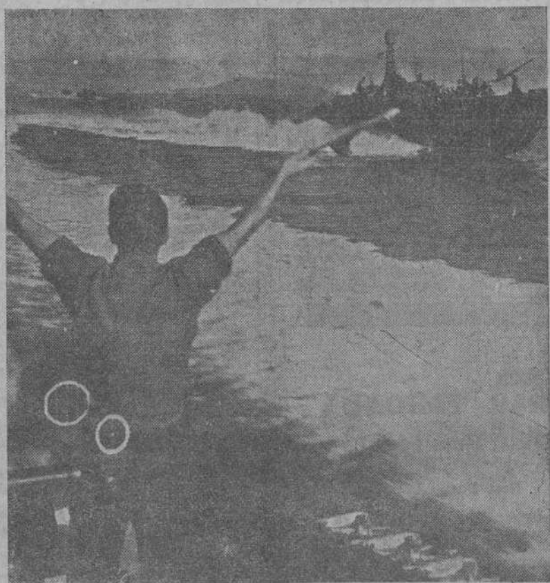
Un señalero sobre una lancha torpedera norteamericana transmite un mensaje a otra embarcación, mientras marchan en patrulla por el Pacífico.