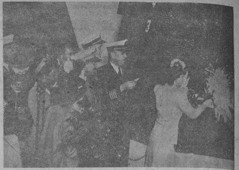
La esposa del general de división Julián G. Smith, que dirigió la invasión del atolón de Tarawa, rompe la tradicional botella contra la proa del portaaviones "Tarawa", de 27.000 toneladas, en la ceremonia de su botadura.