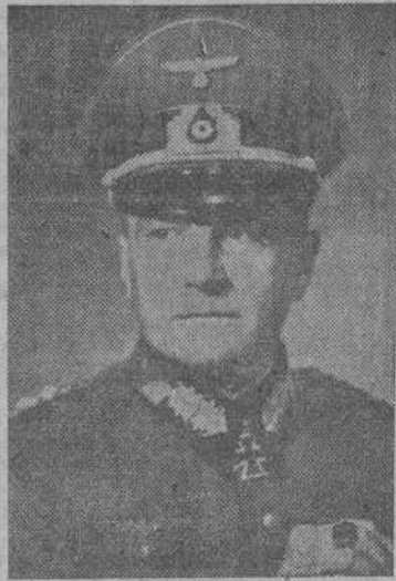
"Bismarck (Ministro alemán en Roma) comunica que ha sido destituido von Brauchitsch (jefe supremo de la Wehrmacht). Esto es señal de una grave crisis". — El general von Brauchitsch.

19 de diciembre.—"Siguen siendo malas las noticias procedentes de Libia,