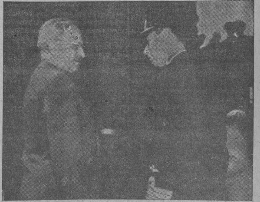
El Presidente Truman conversando con el Rey de Inglaterra a bordo del "Augusta" durante su reunión en el puerto de Plymouth