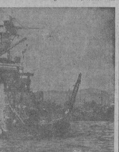
"Von Ribbentrop está contentísimo por el ataque de los japoneses contra los Estados Unidos...". La foto recoge una vista del puerto de Pearl Harbour con el acorazado "California" medio hundido en primer término..

Los mensajes de Hitler y Goebbels no han causado buena impresión. La humilde y urgente demanda de ropa de abrigo para los soldados del frente del Este constituye un contraste ma-