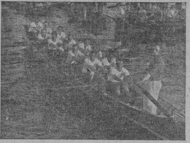
La "Maria del Carmen" vencedora en la segunda regata interclubs...