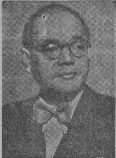
Recibo a Bose. Cuando le dije que había sido nuevamente aplazada la declaración en favor de la independencia india, a petición de los alemanes, se mostró muy decepcionado. Estima que estamos haciendo el juego al Japón, país que actuará por cuenta propia cuando le convenga, sin hacer caso para nada de los intereses del Eje. --Subbas Chandra Bose.

NOTICIAS ADELANTADAS DEL PACTO ALIADO 11 de junio.—"Bismarck telefona para decirme que hay rumores de una alianza entre Estados Unidos, Gran Bretaña y Rusia, y que Norteamérica ha prometido abrir un segundo frente contra los alemanes. (El pacto anglo-ruso por veinte años fué anunciado en Londres el 11 de junio). Es la inyección anglosajona para que los rusos no se derrumben. 12 de junio.—"Me dicen que uno de nuestros submarinos ha hundido por equivocación al vapor "Usodinare". 20 de junio.—"El general Carboni ha llegado a Roma para hablar de la invasión de Malta. Está convencido de que vamos a sufrir un desastre terrible. Los preparativos han sido infantiles y el material es poco eficaz o inútil. Las tropas de desembarco no desembarcarán nunca, y si lo hacen están condenadas a la destrucción. Estoy convencido de que no realizaremos este proyecto. (Efectivamente, no se llevó a cabo)."