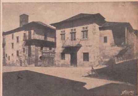
Museo Provincial de Pontevedra