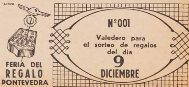
Facsimil del Boleto que recibirán los compradores.

Esta realización de auténtico pondevedrismo propugna una más completa comprensión entre nuestros habituales compradores y el comercio que les sirve, y va examinada a dar a conocer—a quienes de la capital y de las villas que nos rodean, hoy sólo adquieren determinados artículos en nuestra ciudad—la extensa gama de que disponen nuestros comercios para cubrir todos sus deseos y necesidades. Y, naturalmente, también trata de conseguir que quienes hoy no cuentan con Pontevedra para sus compras, lo hagan en el futuro, al comprobar, atraídos por los atractivos de la FERIA DEL REGALO, la verdad de cuanto en nuestra campaña afirmamos.