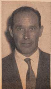
D. Prudencio Landin Carrasco, Alcalde de Pontevedra.

La Feria del Regalo, de Pontevedra, es ya una realidad. Y ante este hecho tan prometedor, que señala una pauta original en la forma de entender el fenómeno del comercio, hemos creído oportuno conocer la opinión de uno de los promotores de este acontecimiento en la vida pontevedresa: D. Prudencio Landin Carrasco, Alcalde del Excmo. Ayuntamiento de la capital.