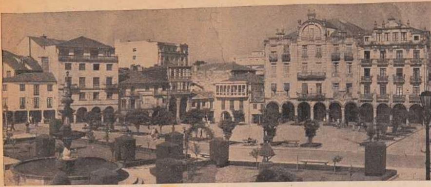
PONTEVEDRA E BOA VILA.—He aquí uno de los lugares más típicos de la capital pontevedresa: la Plaza de la Herrería. En primer término, los bellos jardines de San Francisco, con la fuente de la popular copla.