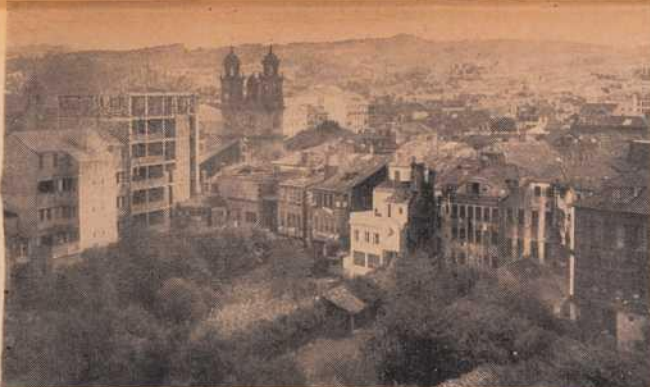
Vista parcial del centro de la ciudad, en el que destacan las barrocas torres de la Peregrina.

Vimos la luna plateando las ruinas de Santo Domingo, que parecen estar esperando la romántica pluma de Bécquer para descri-birlas y el pincel de Villamil—no el cateórico, sino el pintor—, pa-rra copiarlas. Volvimos a sentarnos en la terraza de aquel café fon-tero a la Peregrina y nos recrea-mos en la admiración de la pla-