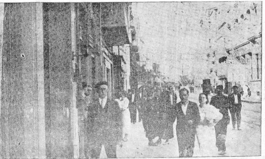
Los comercios abiertos, las gentes paseando tranquilamente por las calles... La Coruña camina rápidamente hacia la normalidad, como lo atestigua la "foto" tomada ayer tarde en la calle de San Andrés

Esperamos de nuestros abonados encuentren justificadísimo este aumento y que seguirán honrándonos con su confianza.