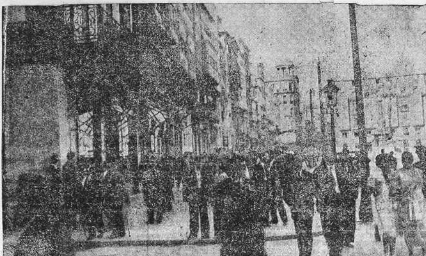
Nuestra capital camina rápidamente hacia la normalidad más completa. Desaparecidos los "paños", he aquí el aspecto que ayer tarde presentaba el Cantón Grande, con la acera llena de una gente pacífica que respira a pleno pulmón la paz definitiva que comienza a percibirse en toda España