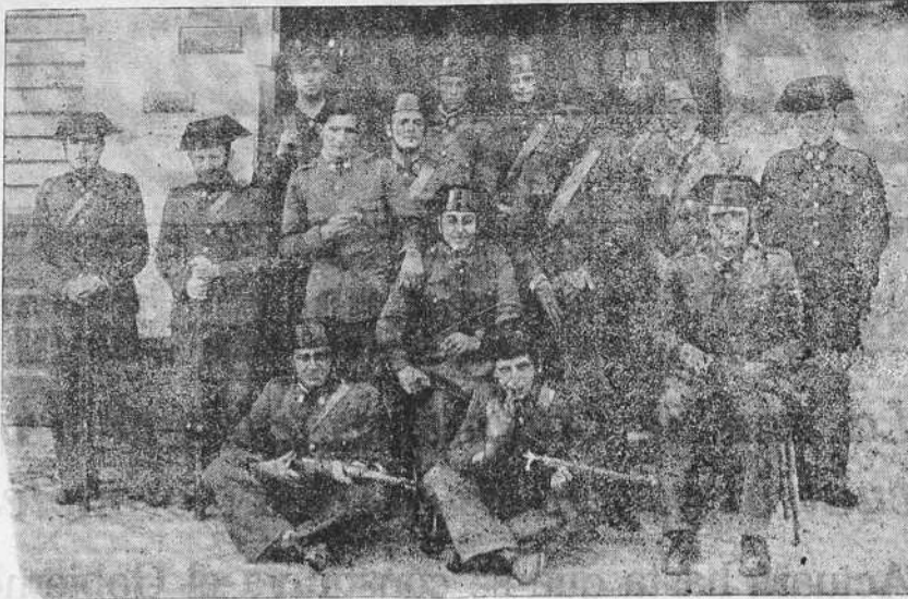
Fuerzas de la Guardia civil que fueron las primeras en llegar a Radio Coruña, donde se les sumaron, luego de un abrazo fraternal, las fuerzas de Asalto que guarnecían la emisora

ESPAÑA EN EL TORNEO OLIMPICO DE HOCKEY Se ha confeccionado ya el calendario de los partidos del torneo olímpico de hockey. Los encuentros que ha de disputar el equipo español, en el grupo C, son los siguientes: Día 2 de agosto, Bélgica-España. Día 4, Holanda-España. Día 6, Francia-España. Día 8, Suiza-España.