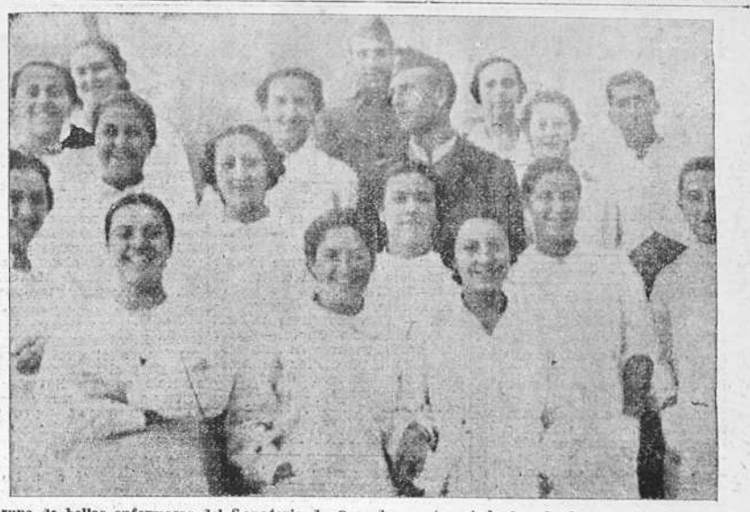
Grupo de bellas enfermeras del Sanatorio de Oza, de nuestra ciudad, rodeadas de valientes soldados

EL IDEAL GALLEGO se vende en Padrón, en la Casa Singsen