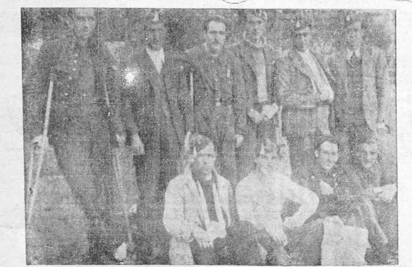
GUARDIAS DE ASALTO, HERIDOS EN EL FRENTE DE ASTURIAS, QUE SE ENCUENTRAN HOSPITALIZADOS EN EL SANATORIO DE OZA DE ESTA CIUDAD

COLOCAD EN CARTAS, TELEGRAMAS Y DOCUMENTOS Sellos de Recargo Pro Patria, de 10 céntimos DE VENTA EN LOS ESTANCOS