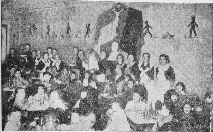
El comedor—todo ternura cristiana y delicadeza femenina—que ayer inauguró la Falange femenina de La Coruña en el barrio de la Silva para dar de comer a un centenar de niños pobres de aquel populoso lugar.

Ha sido instalado en el barrio de la Silva.—Señoritas de la Sección femenina de Falange actúan de camareras