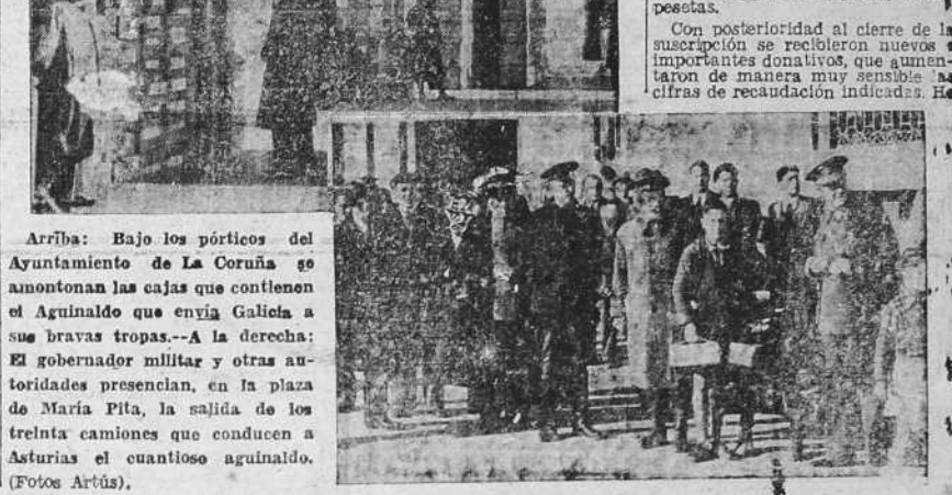
Arriba: Bajo los pórticos del Ayuntamiento de La Coruña se amontonan las cajas que contienen el Aguinaldo que envía Galicia a sus bravas tropas.—A la derecha: El gobernador militar y otras autoridades presencian, en la plaza de María Pita, la salida de los treinta camiones que conducen a Asturias el cuantioso aguinaldo.

En la mañana de ayer salió de La Coruña el gigantesco convoy en el que Galicia envía a los soldados que luchan por la causa de Dios y de España en los frentes asturianos, su aguinaldo de Navidad. El convoy se compone de 30 camiones que conducen artículos por un peso aproximado de 80.000 kilogramos.