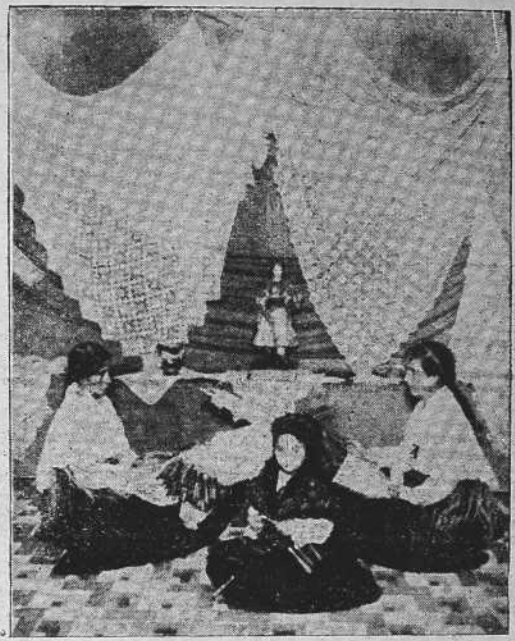
Un aspecto de la Exposición de Encajes de Camariñas y tres "palleras" dedicadas a su bella industria

BERLÍN 16.—El ministro de Negocios del Reich, aceptando una invitación oficial del Gobierno británico, llegará el día 23 a Londres.