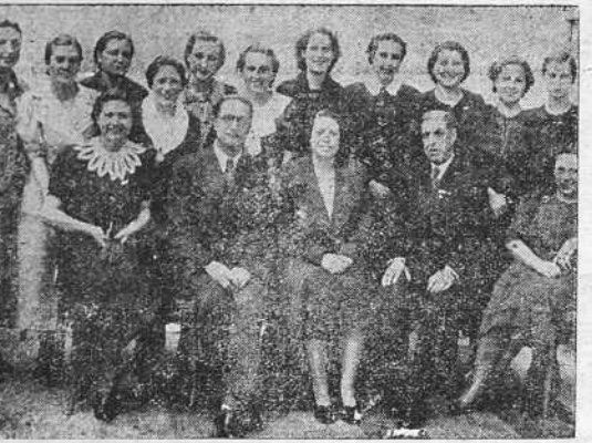
LA CORUNA. Alumnas del grado profesional que han terminado sus estudios en la Escuela Normal del Magisterio. En la fotografía aparecen en unión de sus profesores.

La idea ha sido lanzada por don Gonzalo Valenti en una de sus interesantísimas charlas. Y EL IDEAL GALLEGO la recoge y hace suya para que llegue a conocimiento de todos los interesados.