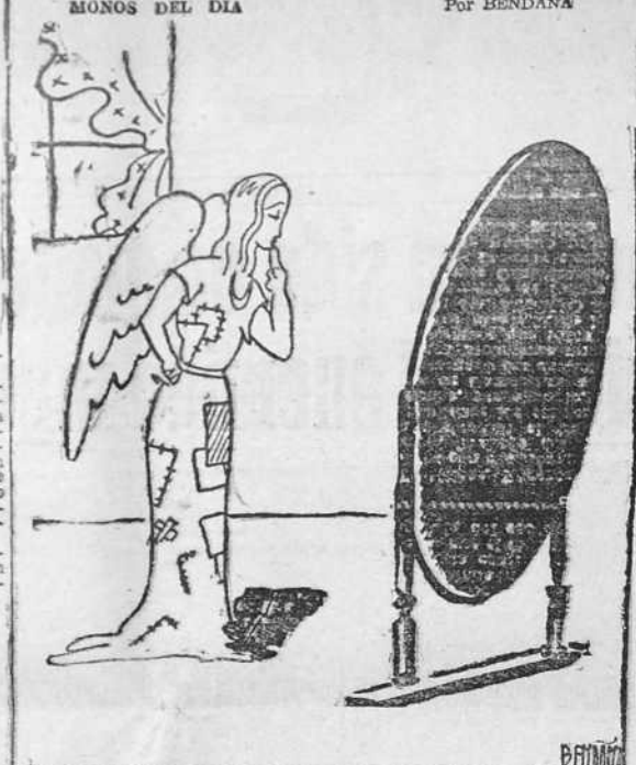
EL ANGEL DE LA PAZ — ¡Me conformo con que me hagan un vestido nuevo!