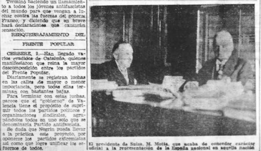
El presidente de Suiza, M. Motta, que acaba de conceder carácter oficial a la representación de la España nacional en aquella nación.