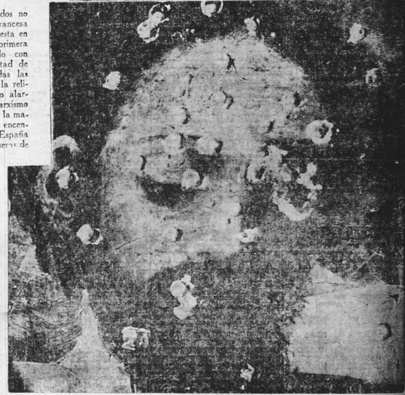
LOS GRABADOS. Imagen del Sagrado Corazón, de la iglesia de la Trinidad, de Ronda (Málaga). La Inmaculada Concepción, del siglo XVIII, iglesia de Aracena (Sevilla). Fueron destruidas, como otros millares, en cuantos sitios dominó la horda, a golpes de hacha. Fragmento de un valioso reabdo que existía en la ermita de la Salud, de Posadas (Córdoba). Fue tiroteado y rasgado por las hordas rojas del Gobierno.