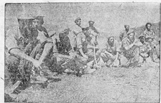
Un momento de reposo en el frente.

En el sector del Ebro ha continuado hoy la batalla, consiguiendo nuestras tropas nuevo avance después de vencer una vez más la res-