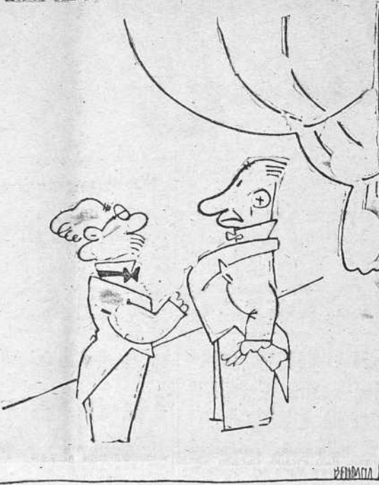
LA INFLUENCIA DEL AMBIENTE --Hay que atacar las notas amigo mio, hay que atacar... --Imposible, profesor; las notas están atrincheradas!...