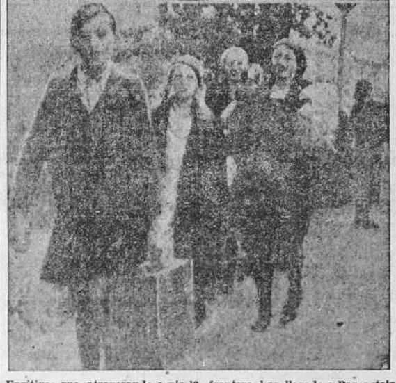
Fugitivos que, atravesando a pie la frontera, han llegado a Barenstein