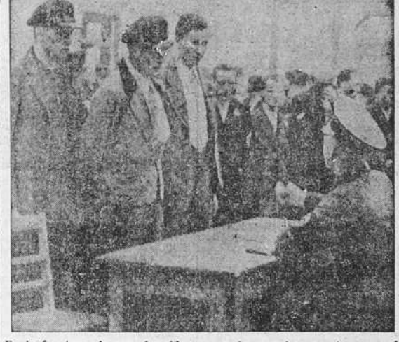
En la frontera alemana ha sido necesario organizar puestos para el control y alojamientos de los sudetes fugitivos de Checoslovaquia