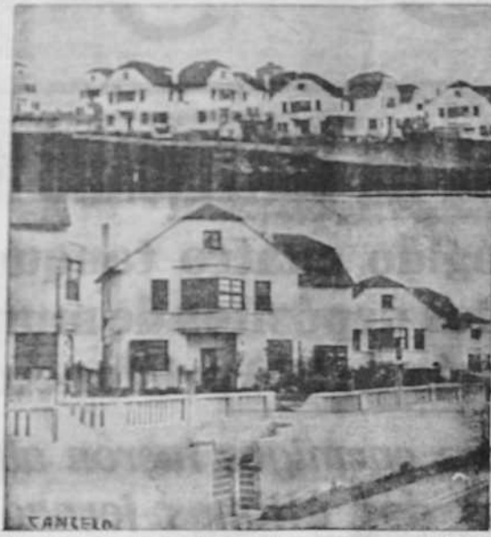
Un aspecto de la colonia de nuevos hoteles construidos en la Ciudad Jardín