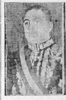
D. Rafael Guariglia, nombrado Embajador de Italia en París

El suceso ocurrió en Londres en la cercanía del hotel donde se hospeda el monarca griego