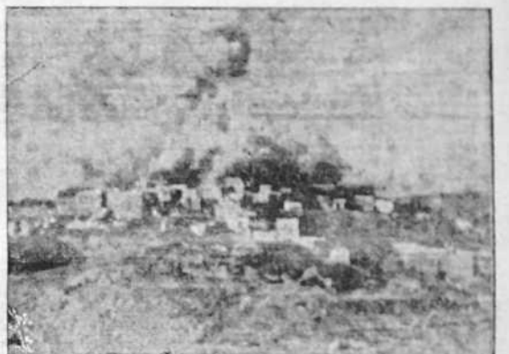
La represión del movimiento árabe en Palestina. Las tropas británicas volando con dinamit a un pueblo rebelde

causando desperfectos en un buque, en los muelles y en los edificios del Arsenal, y el puerto de La Selva, en el que se averiaron los depósitos. Salamanca, 5 de noviembre de 1938. III Año Triunfal. De orden de S. E., el general jefe de Estado Mayor, FRANCISCO MARTÍN MORENO.