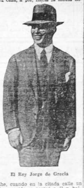
El Rey Jorge de Grecia

LONDRES, 5.—Se ha sabido anoche, según el "Daily Mail", que en la tarde del martes se produjo un intento de asesinato contra el Rey de Grecia, Jorge II, en Downing Street.